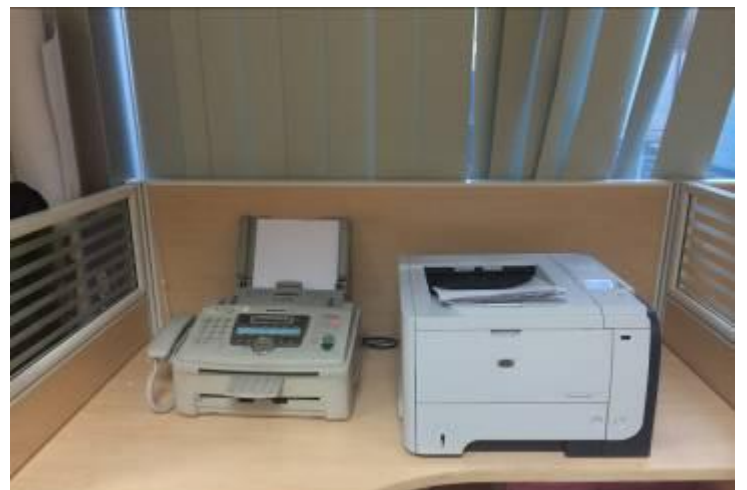
Quang cảnh trước và sau khi dọn dẹp vệ sinh văn phòng của Khối Sản phẩm