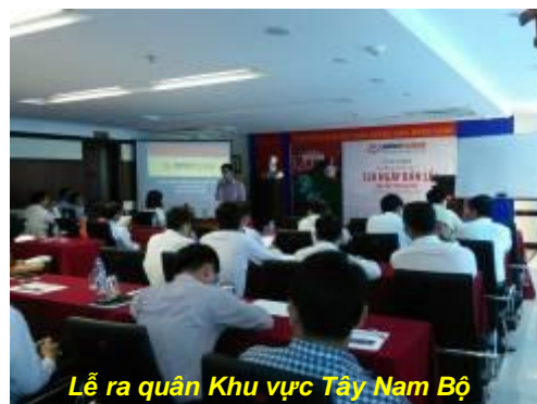
Lễ ra quân Khu vực Tây Nam Bộ