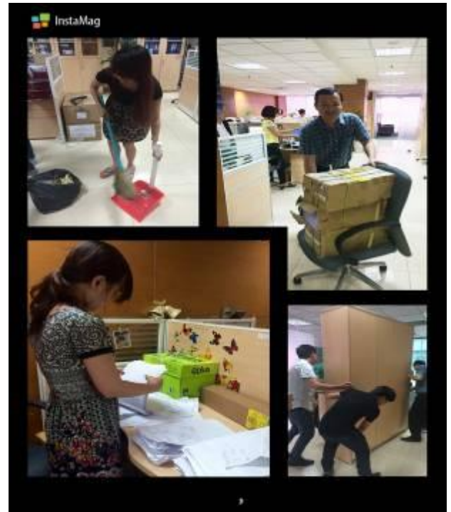
Mọi người cùng bắt tay dọn vệ sinh, kê lại vật dụng, sàng lọc hồ sơ