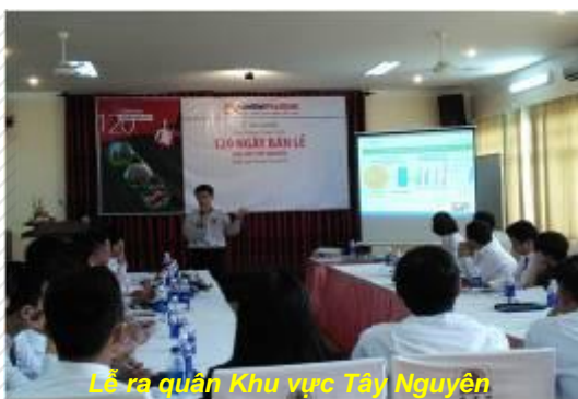
Lễ ra quân Khu vực Tây Nguyên